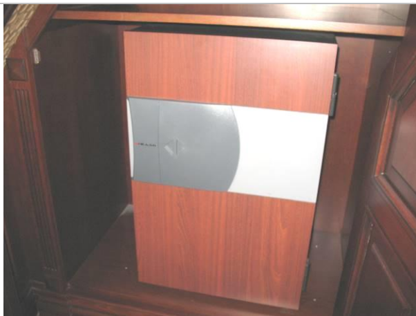
39.G6; BR; 90x60x60; NZ