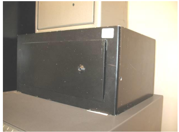
32.G6; M; 40x20x30; NZ