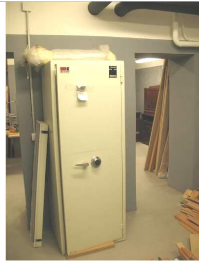
43.MS; P; 170x63x53; NZ