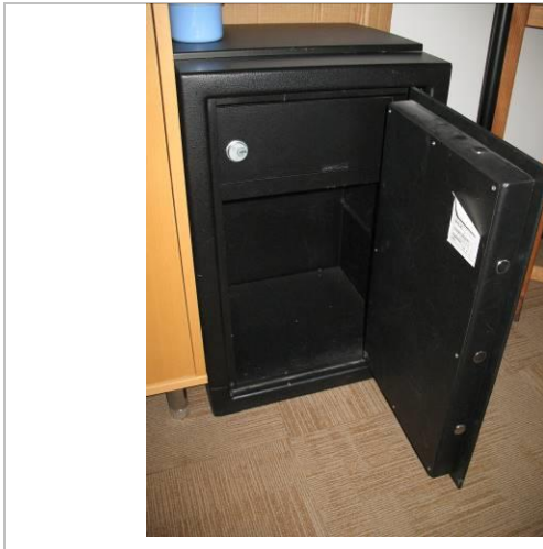
13. G6;M; 60x40x38; A; Vildeta