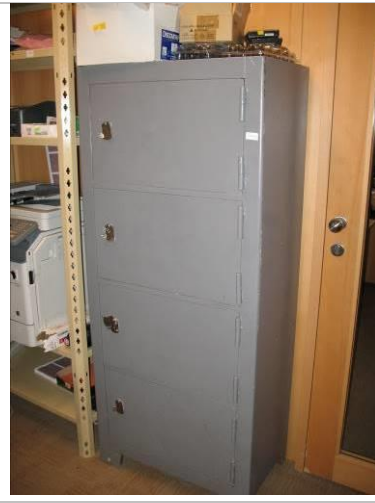
16. G6; P; 170x60x40; A