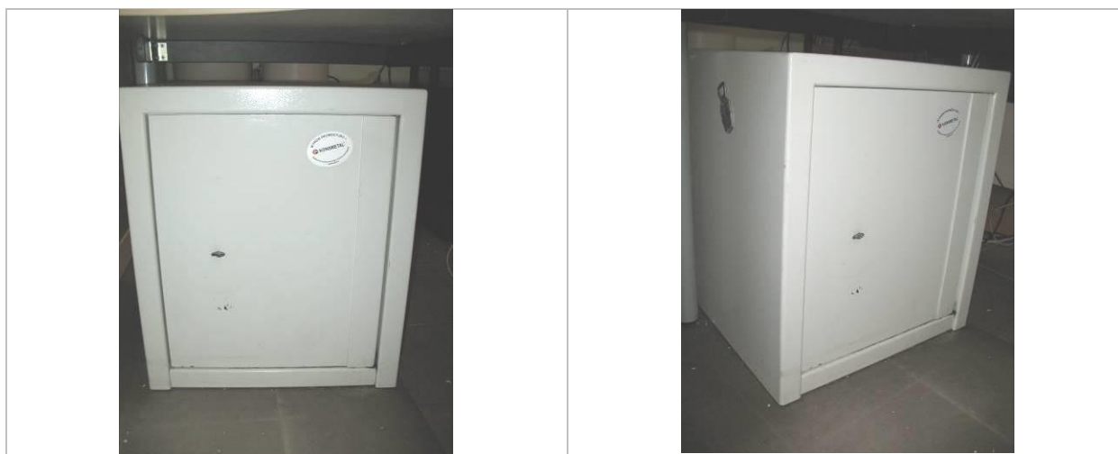
1.K43; B; 60x50x45; A