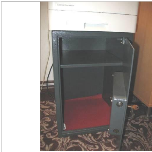
12. G6; P; 53x35x35; A