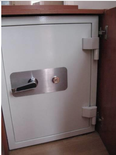
5.K43; B; 80x50x50; NZ