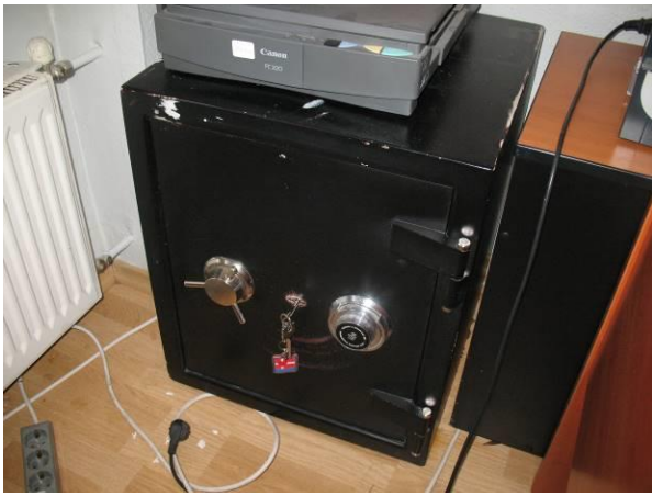
6.K43; M; 60x50x50; A