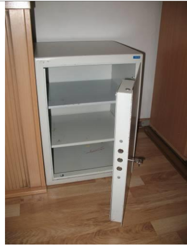
8.K43; B; 55x40x37; A