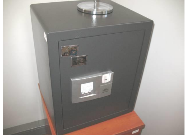
14. G6; P; 50x40x35; A