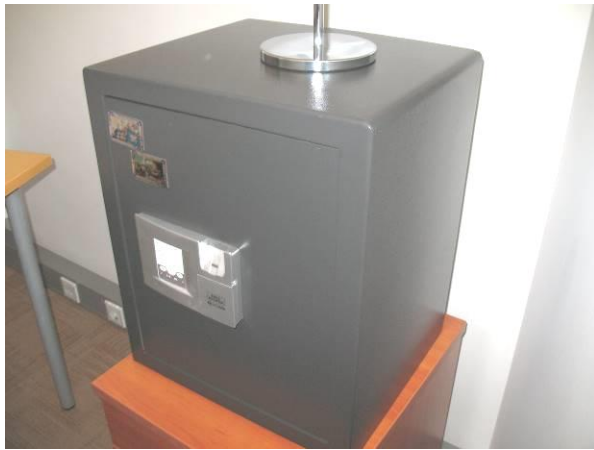
14. G6; P; 50x40x35; A