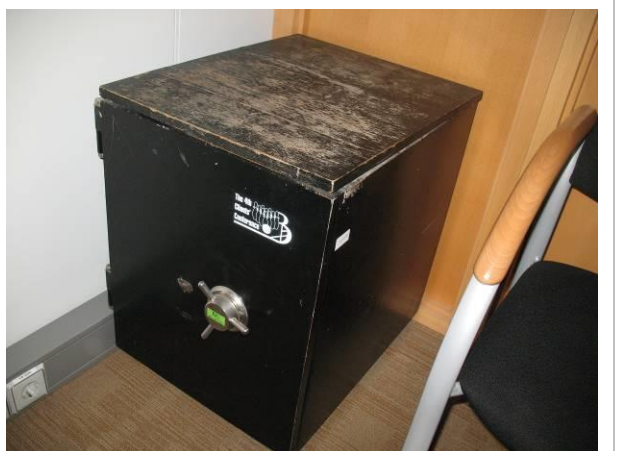
15. G6; M; 60x45x58; A