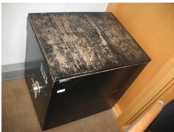
15. G6; M; 60x45x58; A