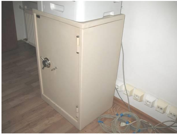
3.K43; GB; 80x53x40;A