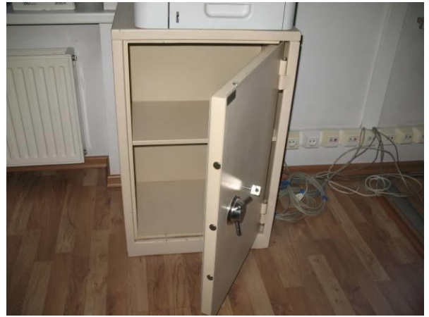
3.K43; GB; 80x53x40;A