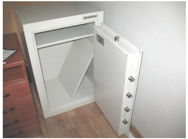
2.K43; B; 90x60x50; A; Konsmetal