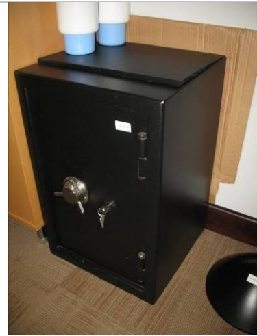
13. G6;M; 60x40x38; A; Vildeta