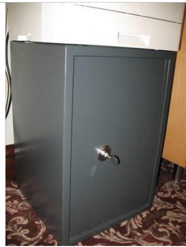
12. G6; P; 53x35x35; A