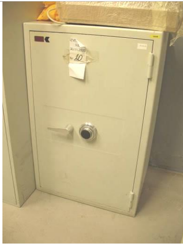
42.MS; P; 100x63x53; NZ