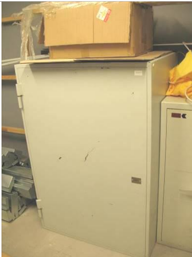
44.MS; P; 123x83x70; NZ Dok.skapis