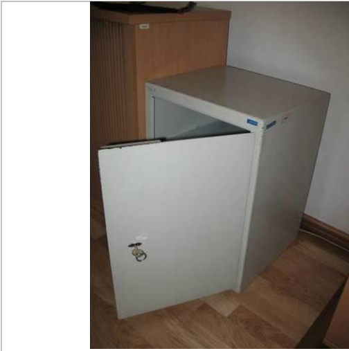
8.K43; B; 55x40x37; A