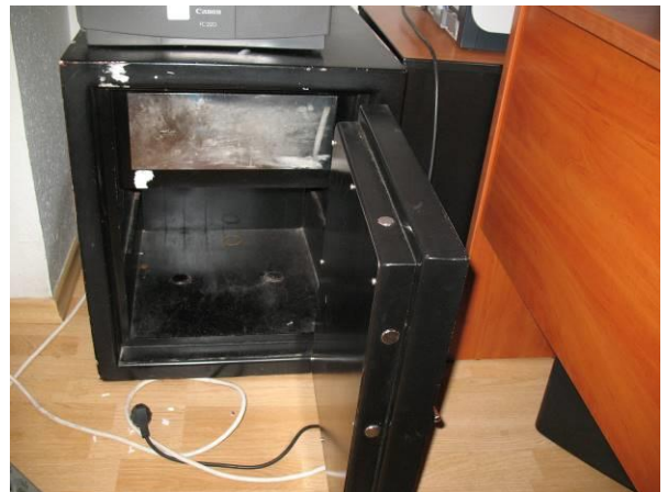
6.K43; M; 60x50x50; A