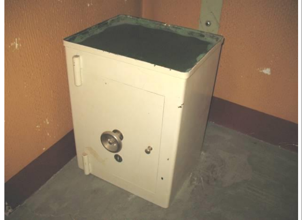
7.K43; GB; 70x55x45; N