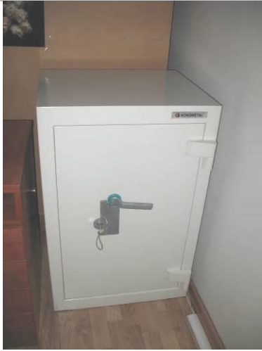
2.K43; B; 90x60x50; A; Konsmetal