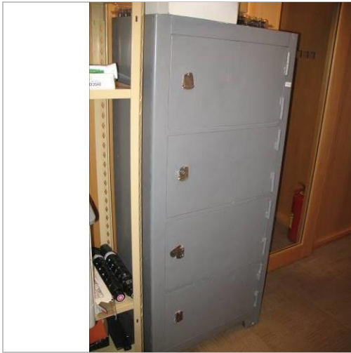
16. G6; P; 170x60x40; A