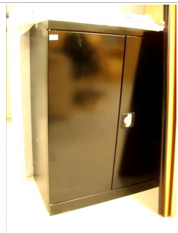
41.MS; M; 100x100x45; NZ