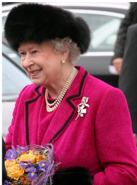
Anglijas karaliene Elizabete II Vinzora. Oļega Auzera sudraba piespraude. Publicitātes foto.

Ļoti augstu Oļega Auzera darbus novērtējusi valsts eksprezidente Vaira Vīķe-Freiberga, kas savas prezidentūras laikā pasūtot sudraba rotaslietas citu valstu līderiem. Elegantu Oļega Auzera piespraudi savas vizītes laikā Latvijā kā dāvanu saņēma un piesprauda pie sava kostīma Anglijas karaliene Elizabete II Vinzora. Sudrabkaļa plastiskie kausi, trauki, brošas un citi darbi rotā Japānas imperatora, Amerikas Savienoto Valstu prezidenta, Vācijas kanclera un citu svarīgu personu kabinetu vitrīnas. Oļegs Auzers savus darbus dāvināja Melngalvju namam, Rīgas kuģniecības un vēstures muzejam, Limbažu muzejam un Šveices valsts muzejam Cīrihē.