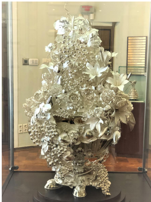
Skats no priekšpuses