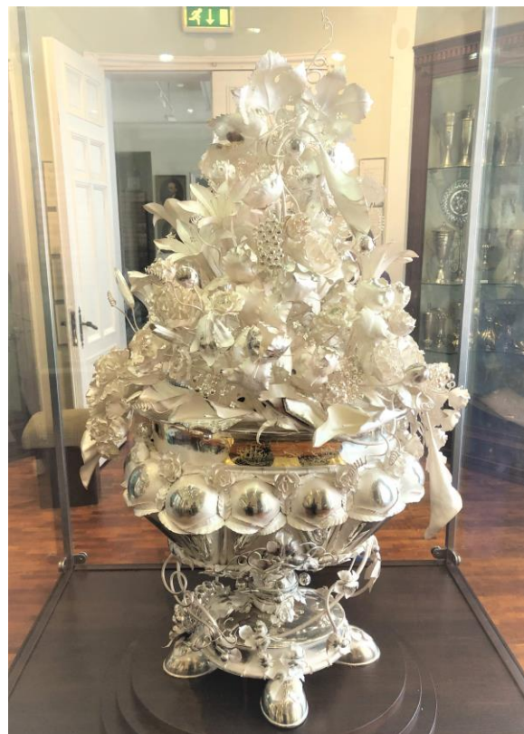
Skats no aizmugures