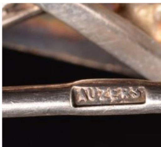
Oļega Auzera autora zīmes piemēri no citiem darbiem