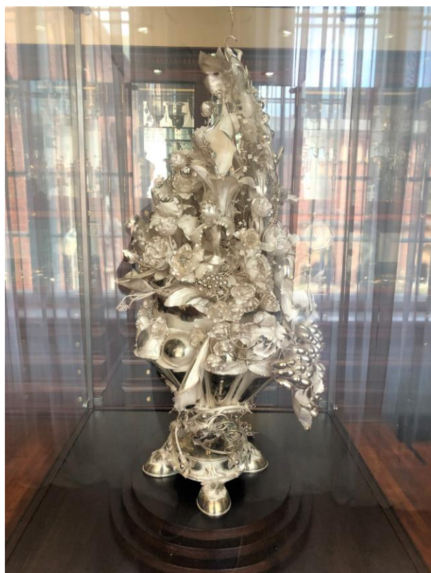
Skats no kreisās puses